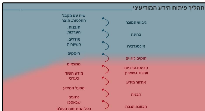
תרשים 1: המשגה עדכנית לתהליך פיתוח הידע המודיעיני, בבסיס לבניין הכוח באמ"ן

בטרם נסביר את השכבות השונות בתהליך, נזכיר רק שאמנם התהליך נראה לינארי וחד-כיווני, אך בפועל הוא רחוק מזה. ניתן ורצוי להתחיל את התהליך המודיעיני ממקומות שונים בתרשים, לחזור איטרטיבית על חלקים מתוכו, וכמובן לחזור בסופו להתחלה עם היזון חוזר והתקדמות נוספת.